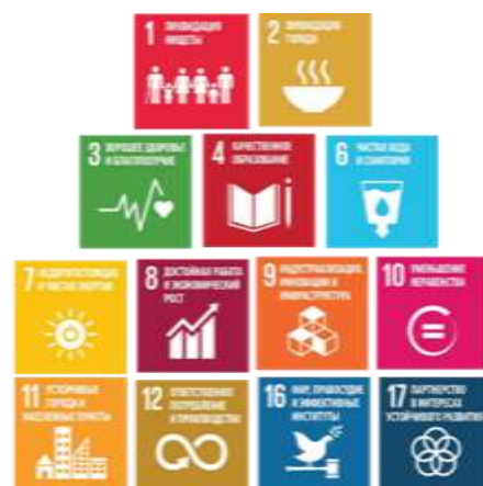
Рис. 3 – Вклад акселератора 2 в достижение ЦУР

Реализация мероприятий регионального акселератора «SMART-управление развитием или цифровизация процессов развития» внесут вклад в достижение ЦУР 1, 2, 3, 4, 6, 7, 8, 9, 10, 11, 12, 16, 17 (рис. 3).