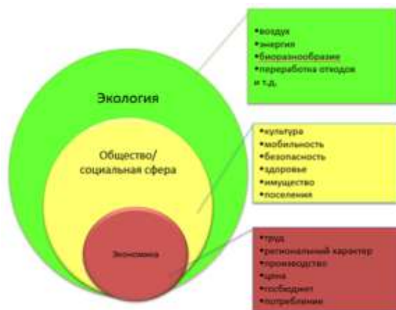
Рис. 1 – Модель сильной устойчивости развития

Видение будущего развития Могилевской области к 2035 г. представлено в соответствии с моделью развития на основе сильной устойчивости (рис. 1). В основе устойчивости развития – экологическая ситуация региона, благоприятная для жизнедеятельности и развития жителей области. Экономика области является эффективным инструментом для сохранения экологии и развития человека в гармонии с природой.