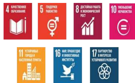
Рис. 5 – Вклад акселератора 4 в достижение ЦУР

Реализация мероприятий регионального акселератора «Вовлеченное управление региональным развитием» соответствует рекомендациям миссии MAPS для достижения целей ЦУР в Республике Беларусь и внесет вклад в достижение всех 17 ЦУР, в наибольшей степени 4, 5, 8, 10, 11, 16, 17 (рис. 5).