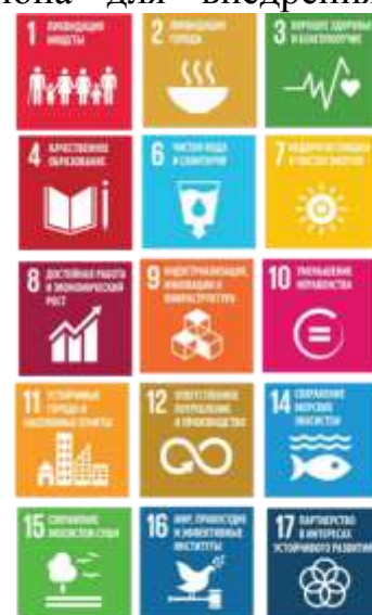
Рис. 4 – Вклад акселератора 3 в достижение ЦУР

Реализация мероприятий регионального акселератора «Территориально-ориентированное развитие и межсекторная кооперация» внесут вклад в достижение ЦУР (рис. 4).