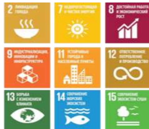
Рис. 2 – Вклад акселератора 1 в достижение ЦУР

Реализация мероприятий регионального акселератора «Экологизация регионального развития» внесет вклад в достижение следующих ЦУР: 2, 7, 8, 9, 11, 12, 13, 14, 16 (рис. 2).